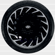
Jantes en alliage léger 20" Pneus 255/45 R20